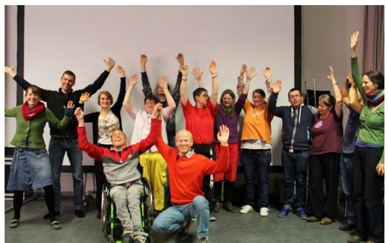
Weimar -- Februar 2015