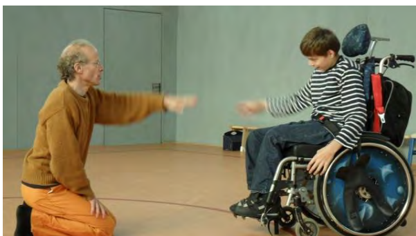
Dresden -- Mai 2014